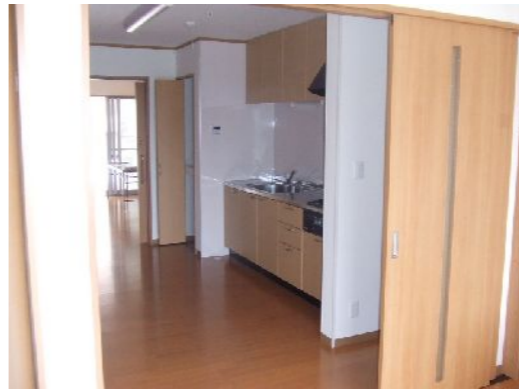
ール、エアコンが完備されており、介護付き高齢者住宅ということで看護師

が常駐し希望者は訪問看護やデイサービスが受けられます。特養ホームと違い、賃貸住宅ですので家族の宿泊は自由ですし、重度化しても退去の必要も無く看取り体制もあるとのことです。