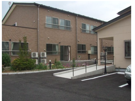
豊のお部屋が五室あります。全室に車椅子対応トイレ、洗面台、ナースコ

昭和町と三俣町でケアマンションを運営する株式会社ヴィータが、青柳町に「介護付き高齢者住宅 ひかりケアマンション 青柳」を作ったというので早速拝見させていただきました。 場所は石井県道から少し奥まった閑静な住宅地で、A棟とB棟の二棟あり、A棟は二階建てで約十一畳のお部屋が二十室、B棟は平屋で約二十三、四